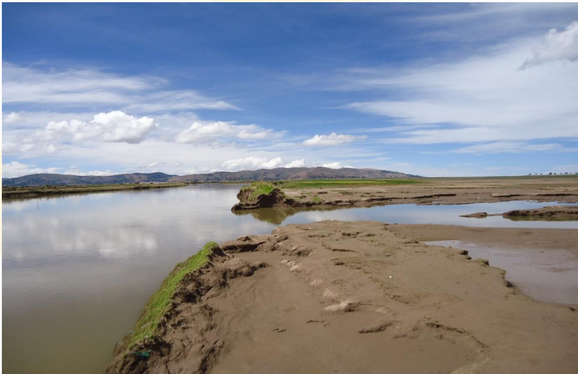
DESBORDE DEL RIO RAMIS - PUNO (Marzo-2012)