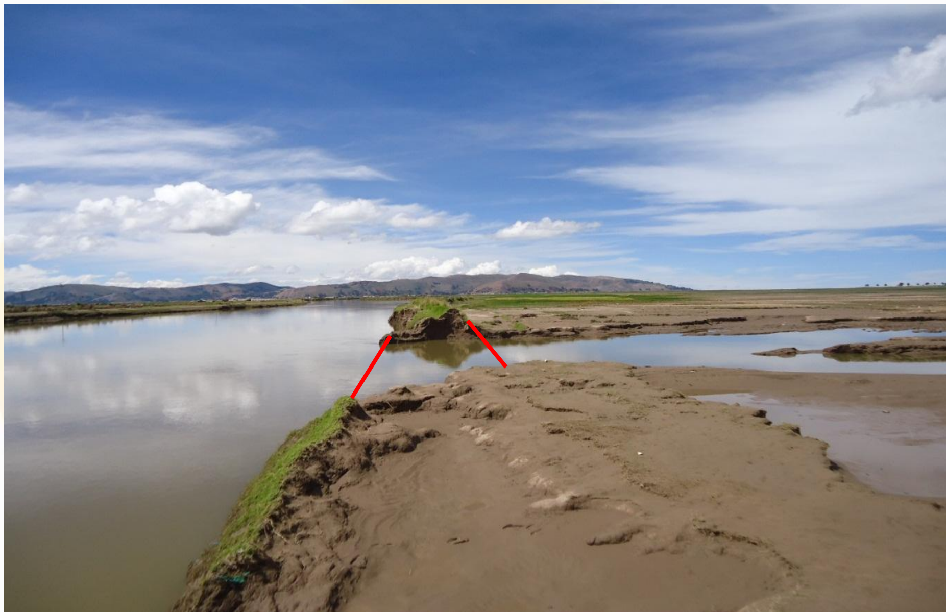
DESBORDE DEL RIO RAMIS - PUNO (Marzo-2012)