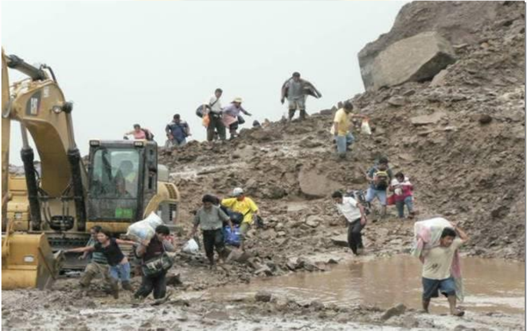
KM 44. PASE DE PERSONAS DURANTE LA RECUPERACIÓN DE LA CARRETERA